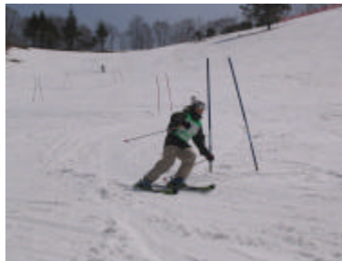
ポールコースの練習