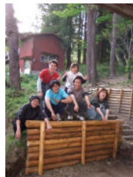
ログ風の土留め (メインホールピロティ)

保護者の皆さん、地域の方々、ボランティアリーダー、スタッフ、皆さんの手でこの赤城キャンプを子どもたちのために整え、守っていきませんか？ワークでは、キャンプサイト内の階段の修繕、デッキのペンキ塗り、道作り、チャペルの椅子の修繕、ワーク参加者の昼食の準備など、内容は様々です。特別な技術がなくてもかまいません。参加したすべての人の力が一つになることでワークは充実したものとなります。リーダーと共に汗をかき、楽しいワークの後には、充実感、達成感を感じることができるとと思います。赤城キャンプがより多くの方々の集いの場になることを願っています。