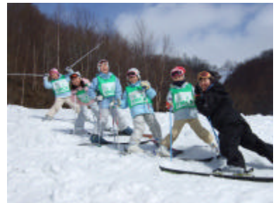
シュプールキャンプ