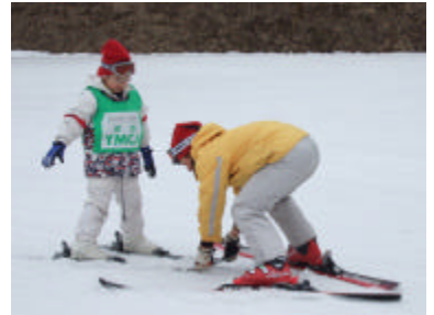
ゆきんこキャンプ