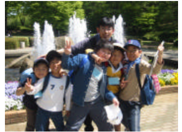
ホビット4月武蔵丘陵森林公園にて 後列中央がデルモンリーダー

ホビットは小学生を対象とした月に1回の野外活動のプログラムです。小学生5~6名のグループにリーダーが1人ついているので、初めて参加する子どもたちでも、何回も参加してくれている子どもたちでも自然に友達やリーダーと仲良