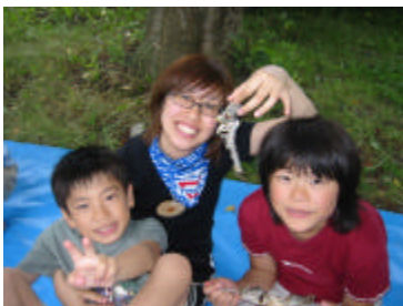
はらぺこ6月 マスつかみどり

はらぺこあおむしは今年で3年目を迎えます。子ども的人数も年々増えてきているので、前年度通りの活動というわけにもいきません。まだ試行錯誤の段階ですが、どの活動に来て、子どもたちが「楽しかった」「おいしかった」「また来たい」と思えるような活動にしていきたいです。